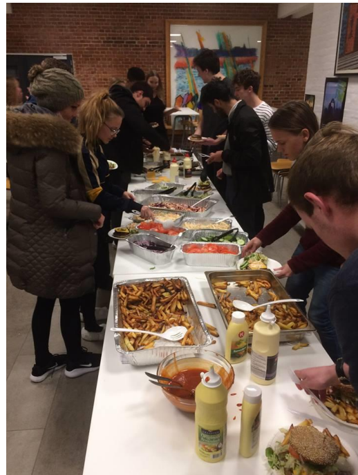
Her ser vi nogle af de "madglade" elever

Vi talte fx med en dame. Hun fortalte, at hun ikke rigtig havde beskæftiget sig med valget, men havde set nogle valgplakater hist og her.