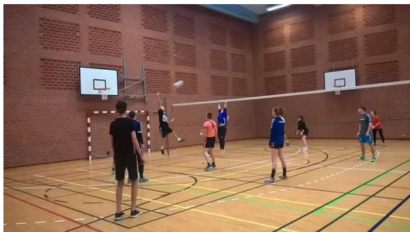
Sidste års volleyballturnering, dengang 1.u mod 2.b.