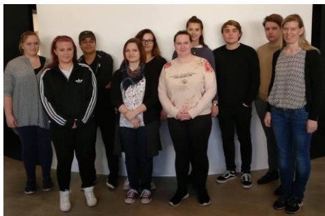
Gruppebillede af musikholdet.

Her på Brønderslev Gymnasium & HF er der mange talentfulde musikere, som har valgt valgfaget musik. For at komme i rigtig julestemning har vi bevæget os hen foran musiklokalet og bliver mødt af et lille musikhold fra 1ou, som i dag kun er bestående af 9 elever.